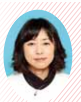
金沢市子ども未来局長